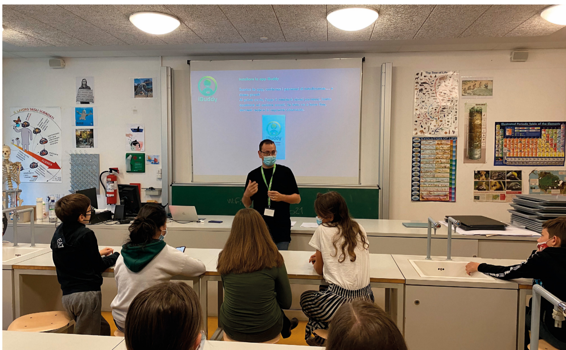
Abbildungen 1 und 2: iBuddy Veranstaltungen durchgeführt in Sekundarschulen im Tessin und in Graubünden - https://www.protectyourdata.ch